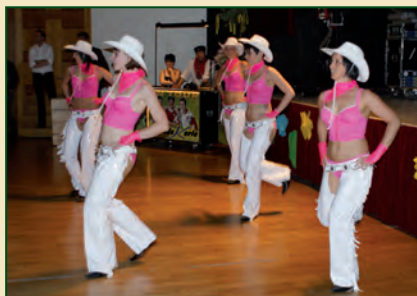
Ballett des Apoldaer Faschingsclubs

Doch dann nahmen die Damen vom Ballett des Apoldaer Faschingsclubs Aufstellung! Sie zogen mit ihrer Show alle Blicke auf sich. Die verführerischen Kostüme waren eine Augenweide und die Zuschauer klatschten begeistert Applaus. Wir möchten uns an